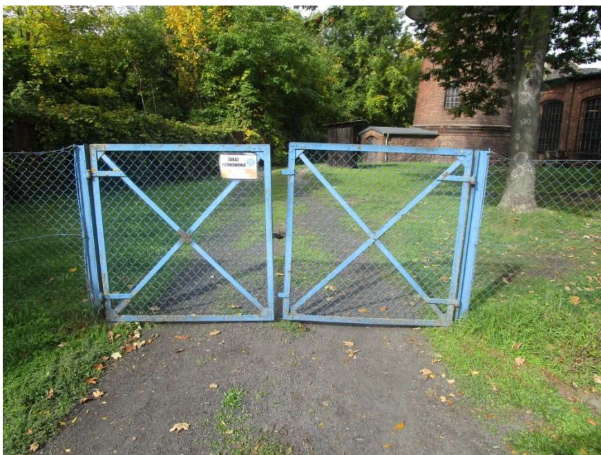
Ogrodzenie i brama – odcinek „A”