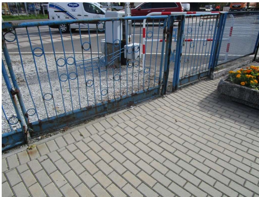
Brama i furтка - odcinek „C”