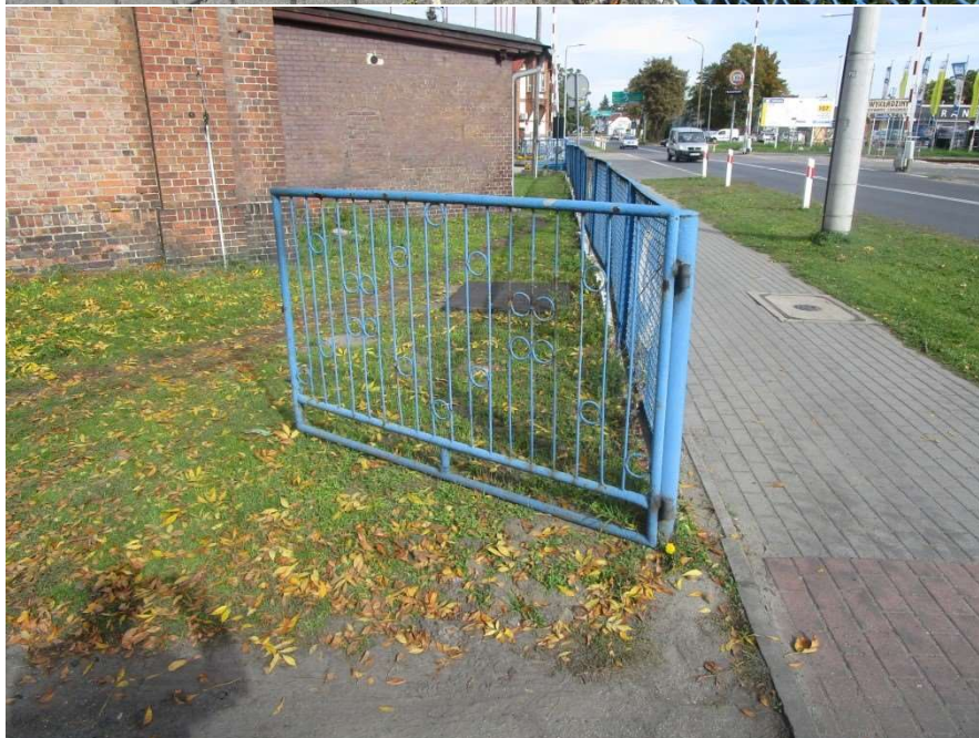
Ogrodzenie i brama – odcinek „B”