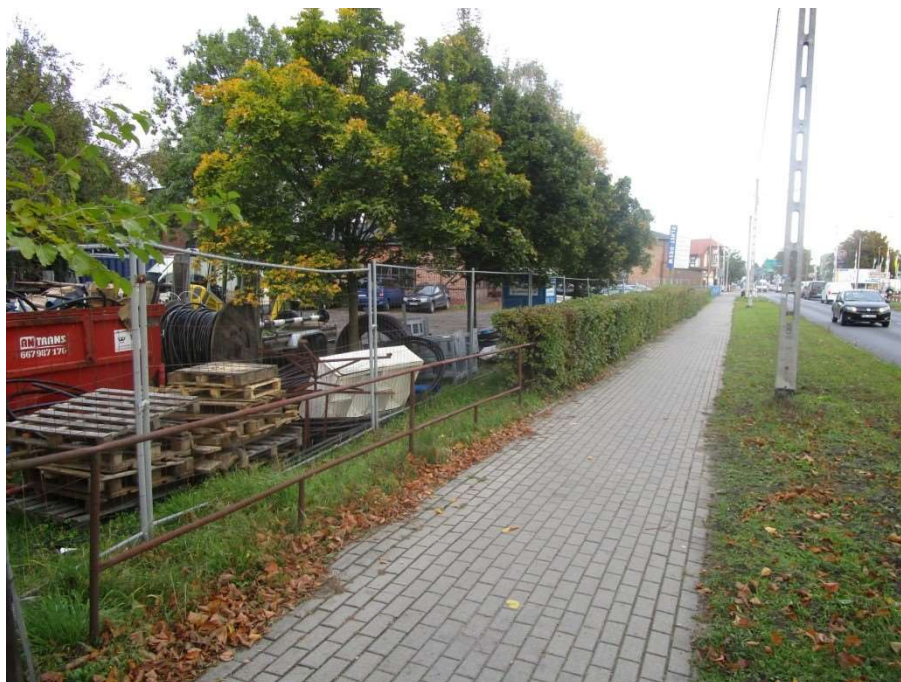
Stalowe barierki – odcinek „B”