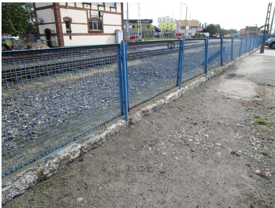
Ogrodzenie – odcinek „C”